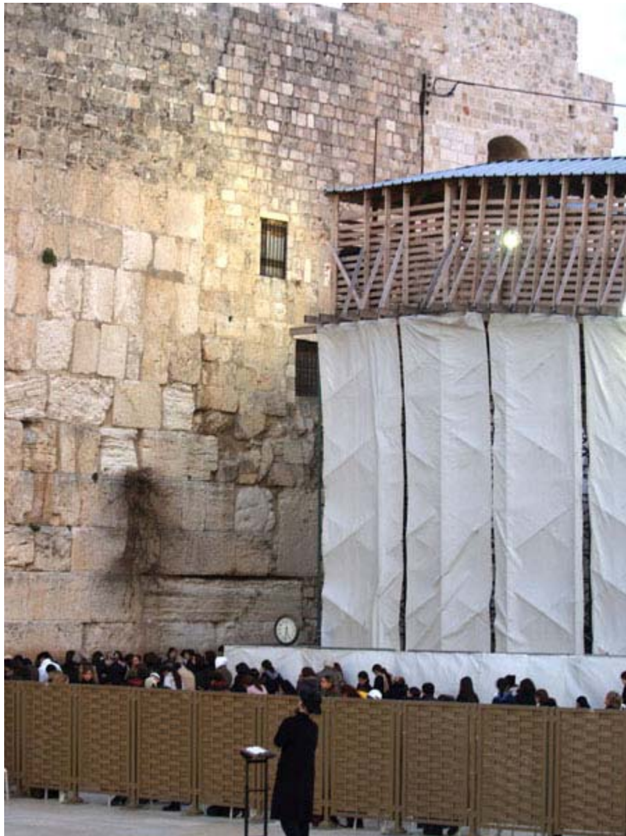
La rampe en bois provisoire vue au niveau du parvis du Kotel