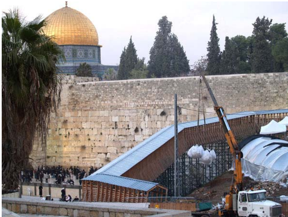
Autre vue du Kotel, avec, toujours à droite, la rampe en bois provisoire, et au-dessus du Kotel, l'esplanade des mosquées avec la Mosquée al-Aqsa.