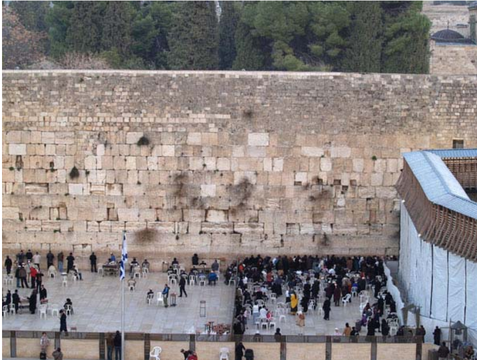
Vue élargie du Kotel, avec la rampe en bois à droite.